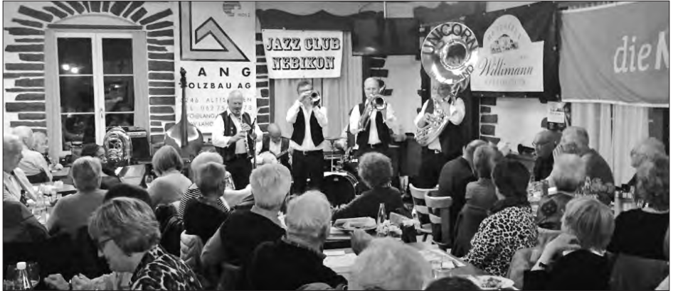
Gute Stimmung zu guter Musik: Unicorn Jazz Band aus Ballwil spielt in der Brauerei Altshofen auf zur Jazz Night.

liegen. Umso mehr freuten sich die Organisatoren des Jazz Club Nebikon, als am Morgen des zwölften Novembers feststand, dass auch dieses Jahr die Jazznight ausverkauft sein sollte – trotz Unterbrüchen und Standortwechsel. Es herrschte gute Musik und gute Laune.