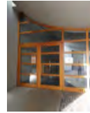
In der Kirche