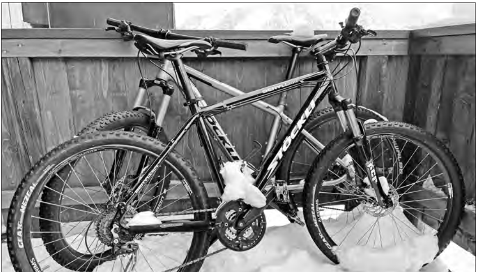
Bike erwacht aus dem Winterschlaf

Wir freuen uns, wenn wir dich im Frühling begrüßen dürfen. Weitere Infos in der nächsten Ausgabe des Nebikers.