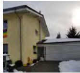
Gässli Nr. 8