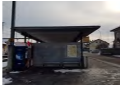
Veloständer am Bahnhof