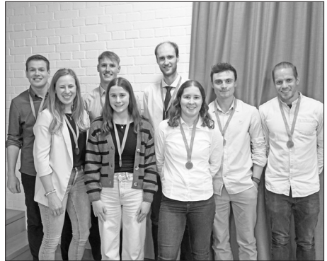
Ausgezeichnete Sportler*innen des ETF 2025.

Ein herzliches Dankeschön geht an das Café Wegere für die ausgezeichnete Verpflegung, an die Frauenriege fürs Schöpfen und den Abwasch sowie an den Vorstand, der wie jedes Jahr im Hintergrund viel Arbeit leistet und die Vereinsversammlung reibungslos über die Bühne brachte.