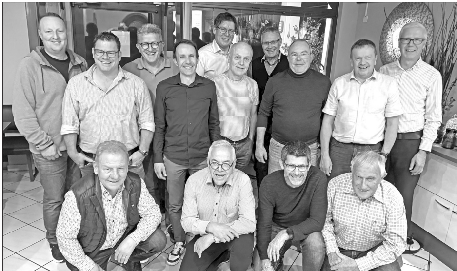
Alle Mitglieder, welche während des Vereinsjahres Sonderaufgaben übernommen haben.