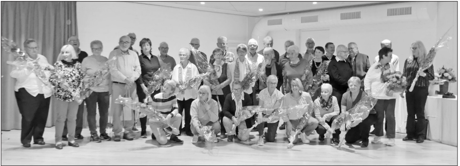
Die Ressort-Geehrten der letzten 35 Jahre.