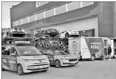
Team Decathlon AG2R (Frankreich)