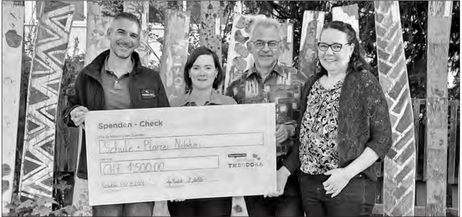
Spenden-Check-Übergabe der Arbeitsgruppe Adväntsmärt und der Pfarrei an die Stiftung Theodora.