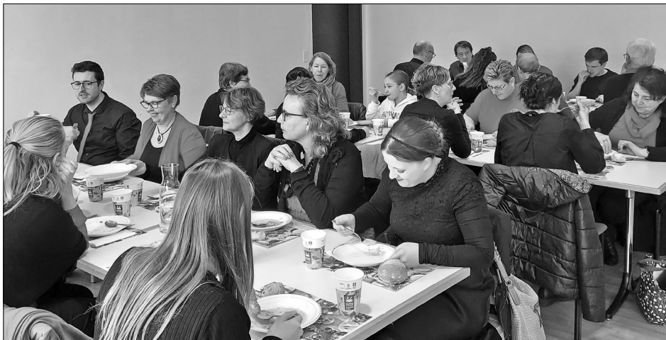
Die Mitglieder des Gospelchors Live in Church geniessen die feine Gerstensuppe nach dem Gottesdienst.

suchen Gedankenanstösse. Es müssen keine grossen Sprünge sein, sondern vor allem auch die kleinen Aktionen zählen.