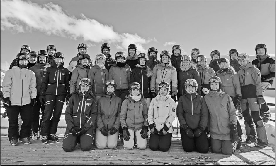
Die Turnerinnen und Turner strahlten in Klosters mit der Sonne um die Wette.

davon nicht abhalten und genossen ausgiebig das Skifahren. Vor der Talabfahrt gönnten sie sich einen Aperitif am Pistenrand und nach dem letzten Schwung ging es direkt zum Après-Ski. Zum Abendessen erwartete sie ein Pasta-Plausch in ihrer Unterkunft. Frisch gestärkt und erfrischt kehrten die Turnerinnen und Turner dann ins Dorf Klosters zurück, um dort die Bars erneut zu erkunden.