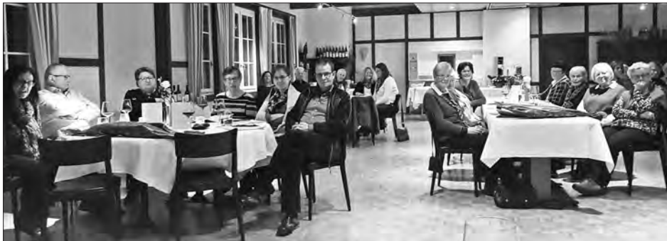
Interessiert zuhörende Mitglieder anlässlich der 55. Generalversammlung des Kirchenchores Nebikon

Vorstandsmitglied verabschiedet und für ihre vielfältige Arbeit mit grossem Applaus verdankt.