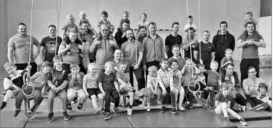
Ein gelungener Morgen im Märchenland, der allen Spass machte.