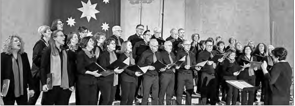
Weihnachtsstimmung beim Adventskonzerts des AlteBasso-Chors

Männern des Chores, des Vorstandes und der im Hintergrund Tätigen.