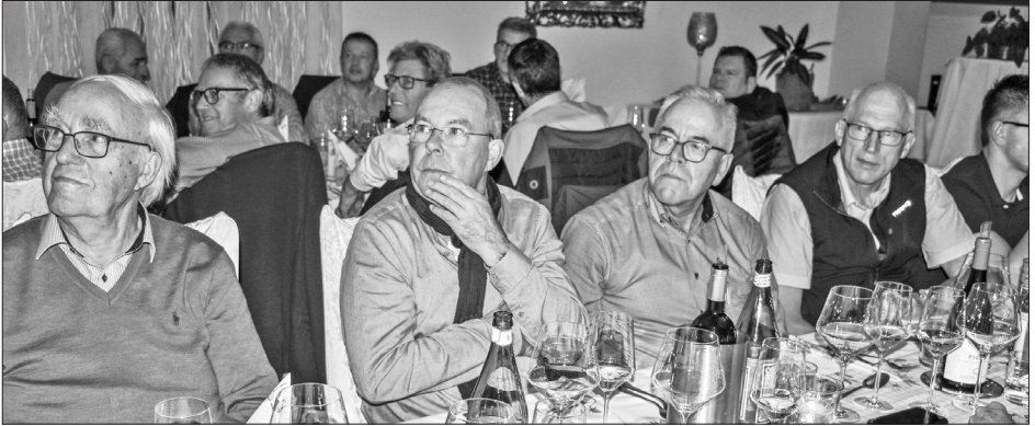
Die Power-Point-Präsentation stiess auf grosses Interesse.