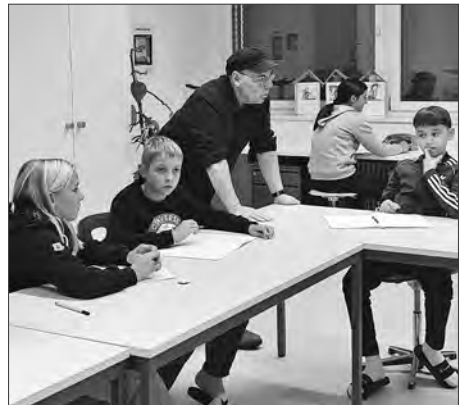
Wie könnte die Geschichte enden? Im Schreibworkshop waren die Ideen der Schulkinder gefragt.

Die erhaltenen Tipps und Ratschläge werden nun an eigenen Texten im Schulzimmer angewendet.