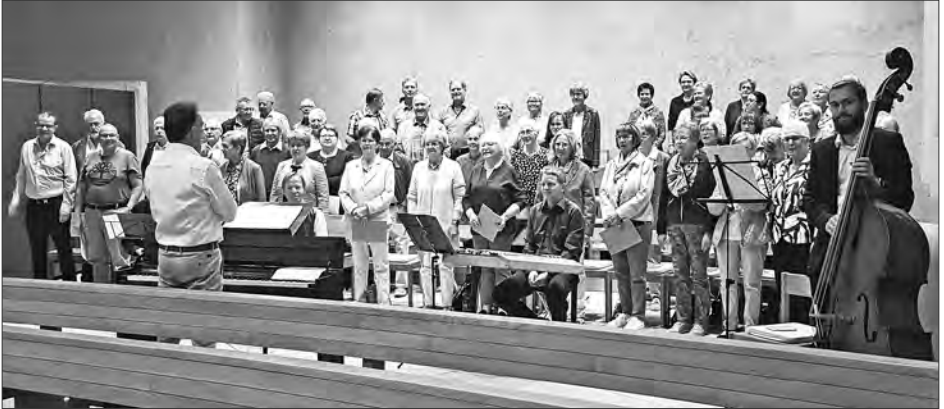
Gottesdienst im Zeichen der Musik.

Den Gastsängerinnen und Gastsängern danken die Mitglieder des Kirchenchores und der Vorstand von ganzem Herzen für die tolle und intensive Unterstützung und Ergänzung.