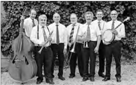
Die Bogalusa New Orleans Jazzband

Seit 2020 musste der Jazz Club mehrmals gezwungenermassen die Lokalitäten wechseln. Nun sind wir nach einem kurzfristigen Umzug nach Altishofen wieder zurück in Nebikon. Mit dem Pfarreisaal haben wir eine gute Lokalität, die akustisch, sowie vom