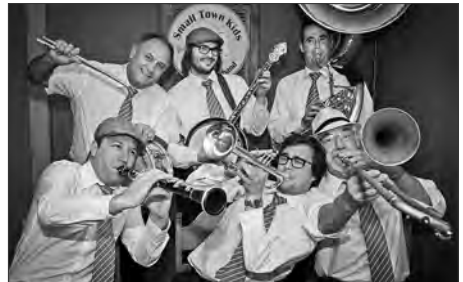
Die Small Town Kids

New Orleans Jazz, wie die Bogalusa New Orleans Jazzband ihn spielt, ist eine spontane, vom Kollektivspiel und Einfallsreichtum – vor allem in den Soli - geprägte, harmonische Musik. Dank einer Rhythmusvielfalt wie Blues, Stomps, Boggie-Woogies, Hymnen, Märsche und Walzern, kommt der New Orleans Jazz stets gut an, erfreut und begeistert Jung und Alt. Im Laufe der Jahre hat die Band ein breites Repertoire aufgebaut, das aus bekannten Standards wie auch aus weniger bekannten, traditionellen Themen besteht. Laissez les bon temps rouler!