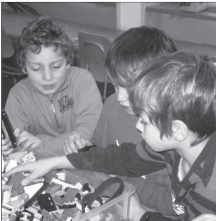
Im Lego-Atelier liessen sich Schülerinnen und Schüler der 2., 3. und 4. Primarklasse zum Spielen anleiten.

Die 22 unterschiedlichen Ateliers wurden stufenspezifisch angeboten. Je nach Thema konnten sich Lernende aus der Unter-, Mittel-, oder Oberstufe, der Primar- oder der Sekundarstufe 1 zur Teilnahme einschreiben.