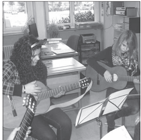
Bei der Anleitung zum Gitarrespielen konnten Jugendliche der Sekundarstufe 1 Griffe lernen und ein Gitarrenstück einüben.