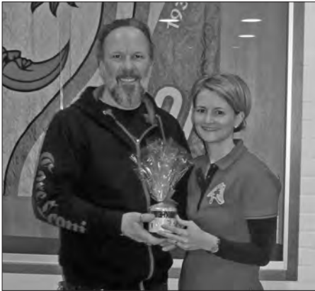
Die geehrten Blutspender bei der Geschenkübergabe.

Wir Samariter und der Blutspendedienst danken Ihnen ganz herzlich für Ihre wertvolle Spende. Die nächste Blutspende-Aktion in Nebikon findet am Montag, 24. Juni 2019 statt.