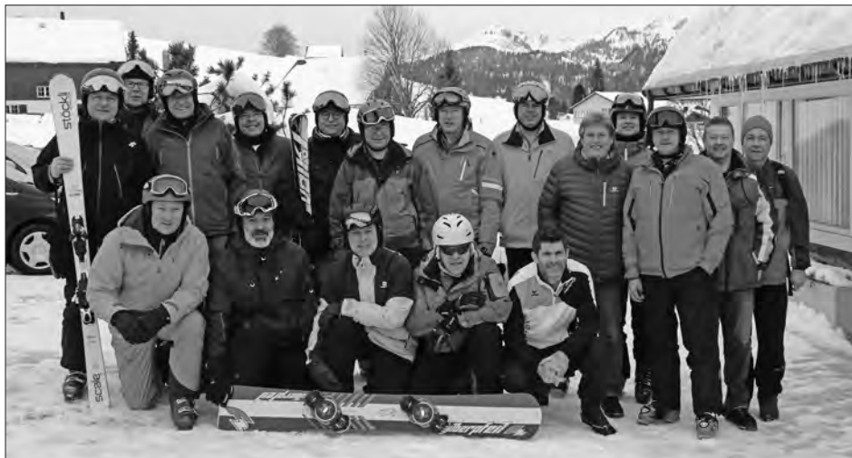
Skiweekend der Männerriege im Toggenburg.

Am Samstag stiessen 4 weitere Ski- und Snowboardfahrer sowie 4 Langläufer dazu. Leider herrschte Nebel, Schnee und Wind vor. Die Fahrten beschränkten sich auf das Minimale. Dafür hatte man genug Zeit für Gespräche, einen Jass und gemütliches Beisammensein. Etwas lauter ging es dann in der Aprésski-Bar zu und die Talabfahrt bei Dunkelheit stellte den einen oder anderen vor gewisse Schwierigkeiten.