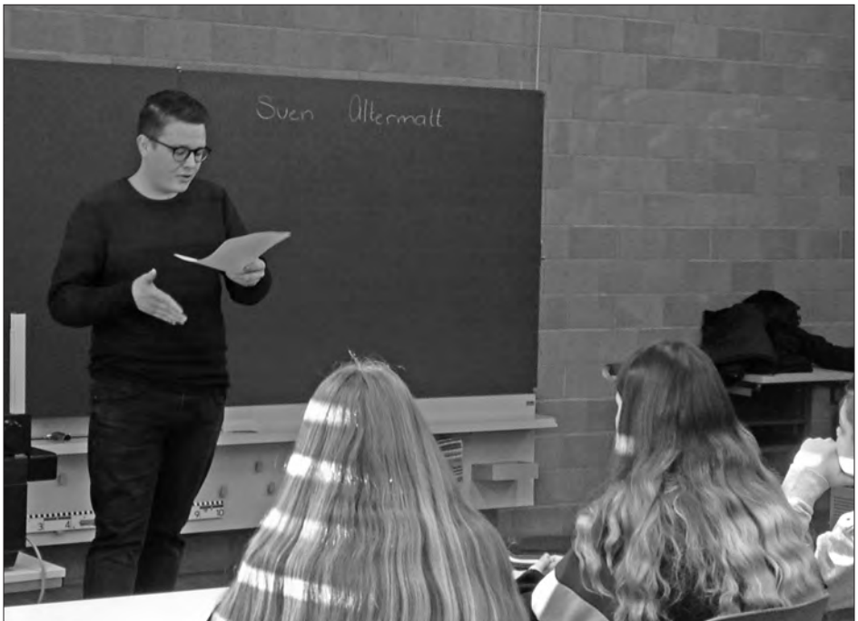
Journalist Sven Allematt zu Besuch bei der 3. Oberstufe in Nebikon.

Die 90 sehr gelungenen Minuten vergingen wie im Flug und mit zahlreichen Tipps und Anregungen aus der Praxis wird das Projekt Abschlusszeitung nun mit vollem Elan weiter vorangetrieben.