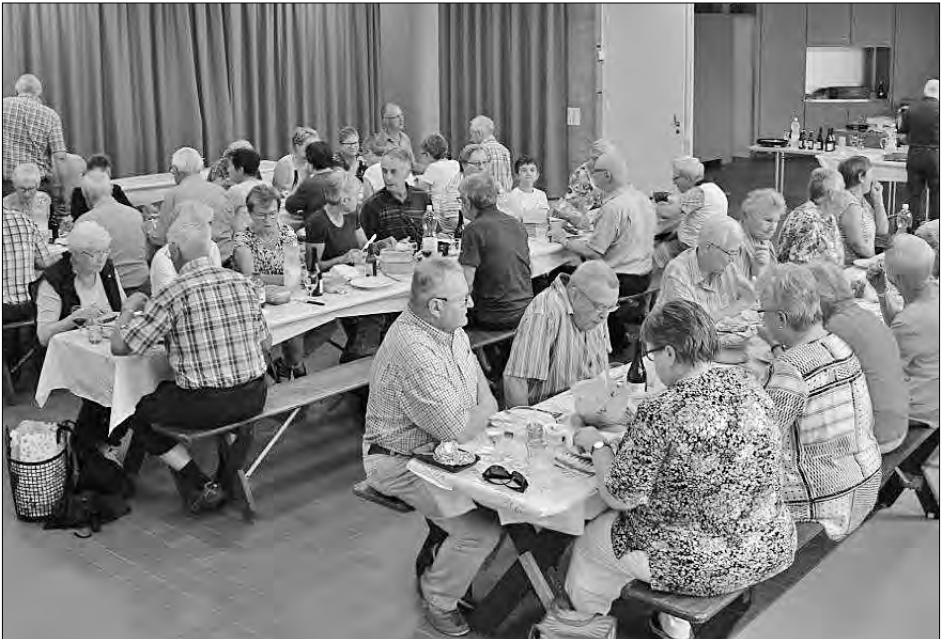
Picknick in gemütlicher Runde.

Bitte reservieren Sie sich bereits heute den 19. Oktober für den Vortrag «Harmonie in Körper, Geist und Seele». Die Veranstaltung wird in der zweiten Tageshälfte stattfinden.