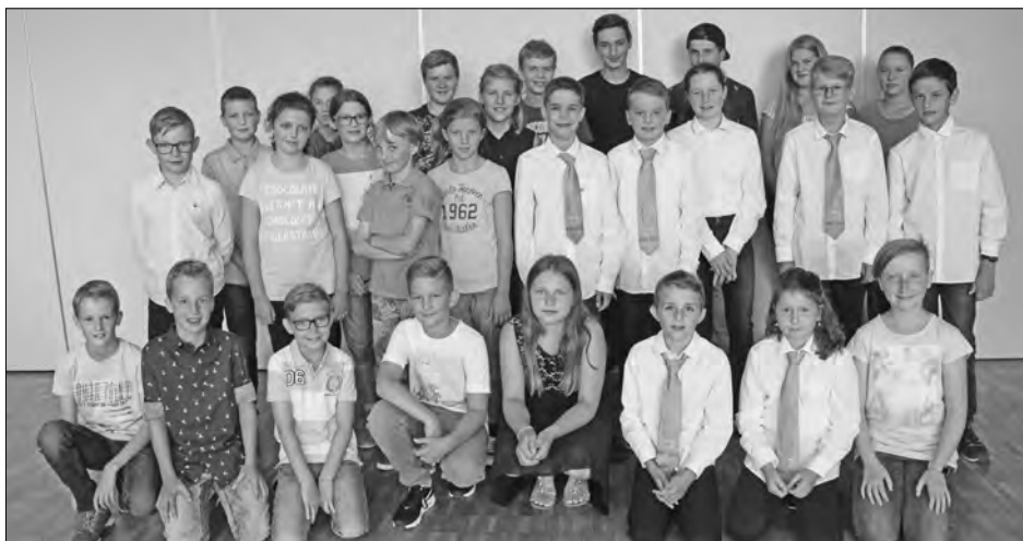
Teilnehmer des 17. Melody Contest.