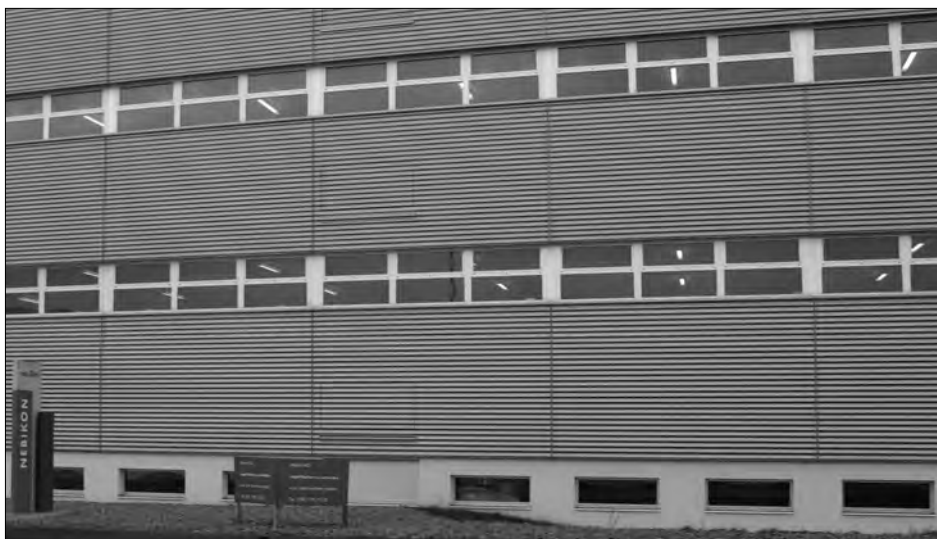
Das Haus von Familie Huber, Vorstadt 41, ehemalige Sägerei, wich 2008 einem Erweiterungsbau der Interio.