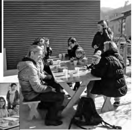
Bildimpressionen «Tag der Volksschule 2016»