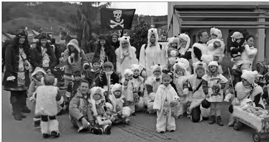
Fasnacht der Familienrunde 2016.