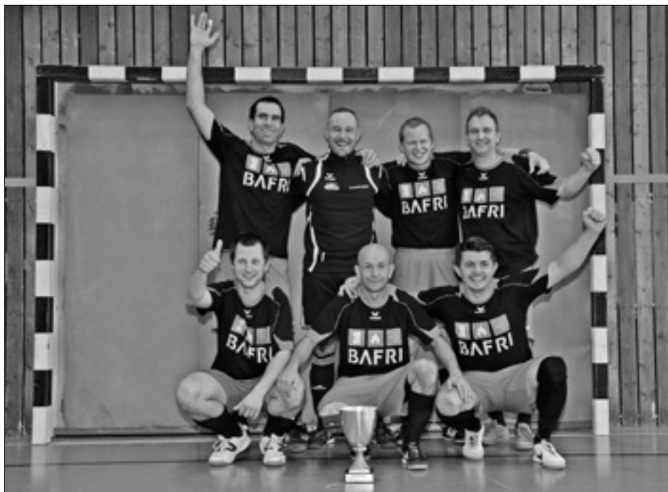
Die siegreichen Senioren des FC Wauwil/Egolzwil.