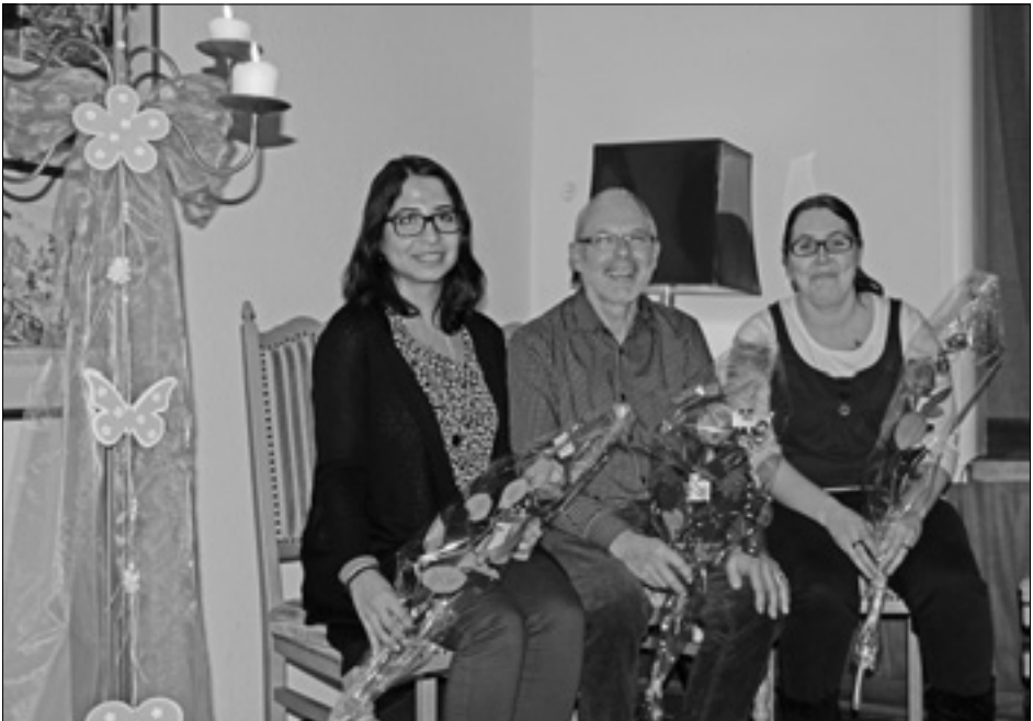
Die neuen Vereinsmitglieder.

Ihr Kommen freut uns und wir wünschen Allen viel Spass und gut Jass.