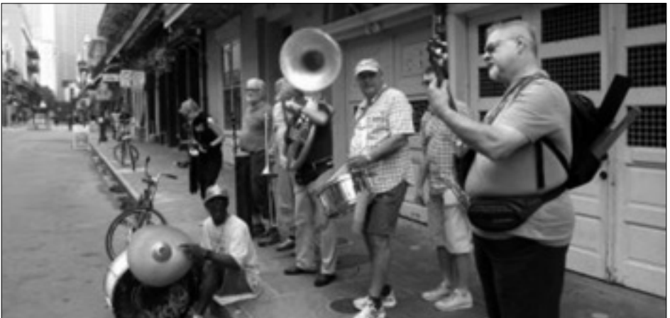
Strassenmusik in der Royal Street

Am Abend spielt sich dann in der Bourbon Street immer ein ähnliches Schauspiel ab: Auf einem Haufen ist Party, christliche Bekehrung und Rotlichtmilieu ... und natürlich viel Musik – 365 Tage im Jahr – eine explosive Mischung! Wenn es sein muss kommt die Polizei mit dem Pferd durch die Menschenmenge angebraut. Und in diesem Haufen durften wir jeden Tag auftreten... New Orleans, wir kommen wieder!