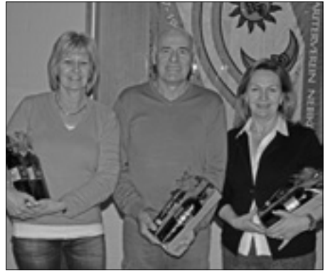
Die geehrten Spenderinnen und Spender