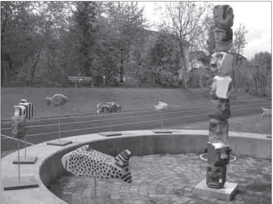
«Gesichter», eine Skulptur aus Ytonstein hinter der Schulanlage.